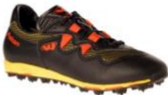
O-sko Lave joggesko med null demping og pigger som i et piggdekk. ikke egnet til dans på parkett