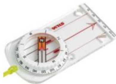
Turkcompass Vanlig å bruke på tur og eventuelt på o-løp