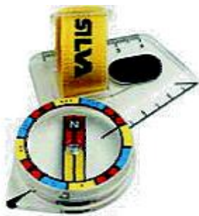
Tommelkompass Vanlig å bruke i o-løp

Man trenger kompass og stemplingsbrikke når man skal være med i løp. Brikke kan man i starten låne av klubben, og man kan også leie på løpene. Bildet under er av den type brikke man bruker i Norge, andre land har andre typer brikker.